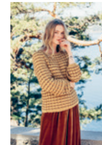
STRUKTURGENSER Design 11