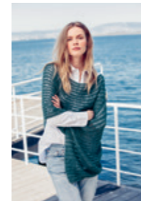
PONCHO Design 9