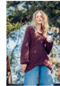
HIPPIEGENSER Design 5