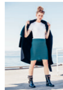
SKJØRT Design 13