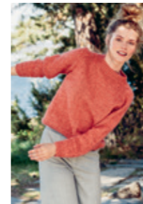
RAGLANGENSER Design 8