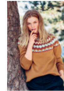
RETROGENSER Design 6