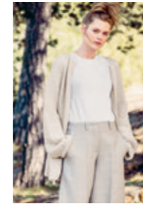
RILLEJAKKE Design 3