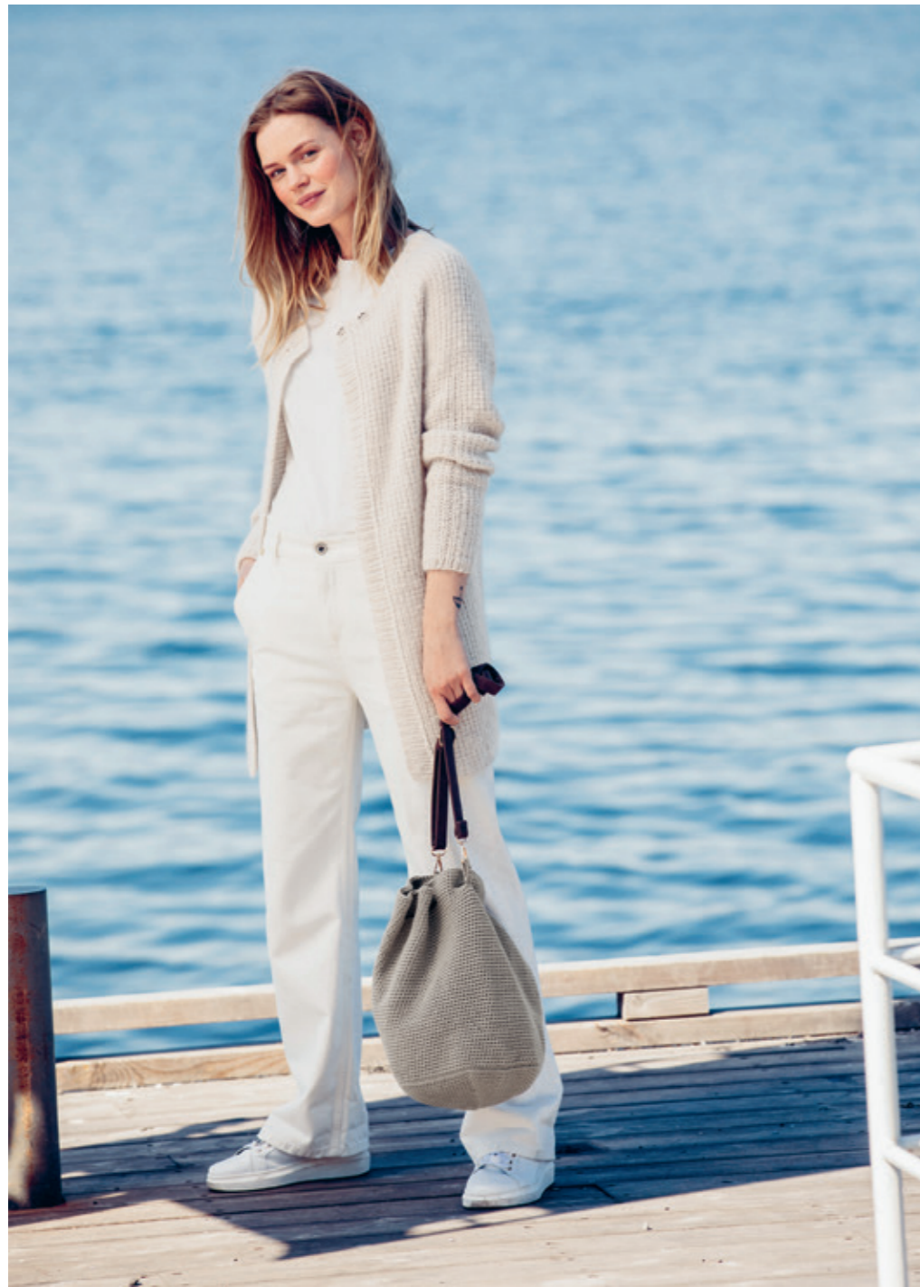
1811 | SISU | X6 | 19|10 | •• STRIEJAKKE 7 | SILK MOHAIR | S-XXL