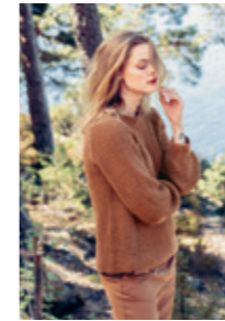
SIGRUNGENSER Design 2