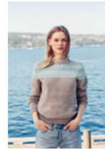
BERGITGENSER Design 1