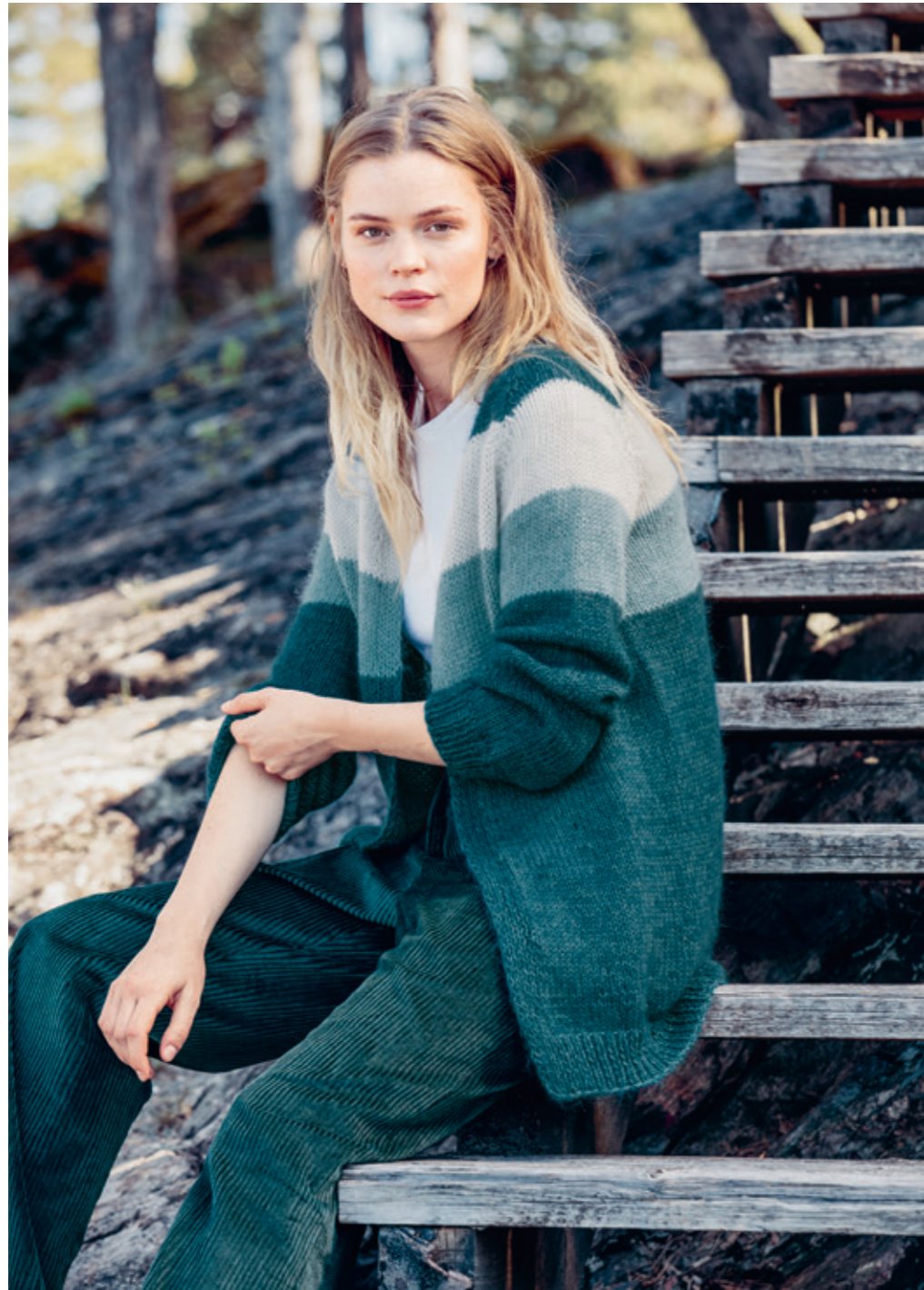
1811 | TYNN SILK MOHAIR | X6 | 15|10 | •• STRIPEJAKKE 4 | DUO | XS-XL