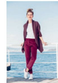
NORAJAKKE Design 12