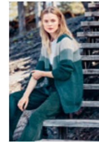
STRIPEJAKKE Design 4