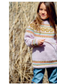
ANITA Design 12