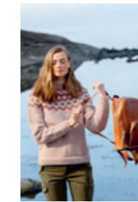
4240S Design 4