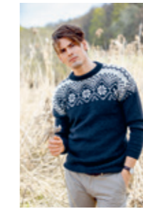
HAUGSETER Design 10