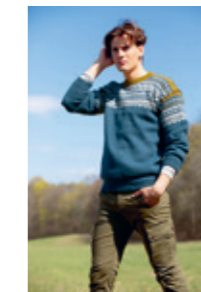
MARIUS Design 16