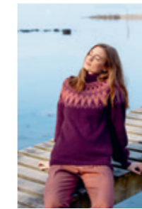
FRISK Design 3