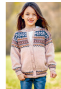
GRANÅSEN Design 14