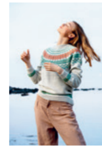
ESKIMOGENSER Design 1