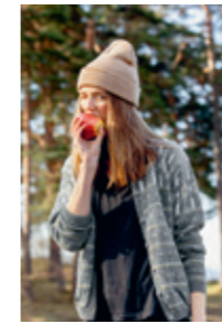
LOFOTEN Design 8