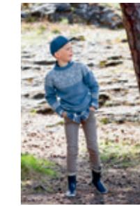
TELEMARK DESIGN 11