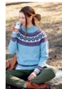
ANITA Design 13