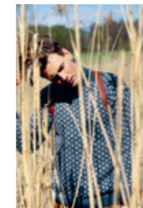
KNUT Design 15