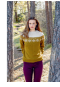
SNØKRSTALL Design 9