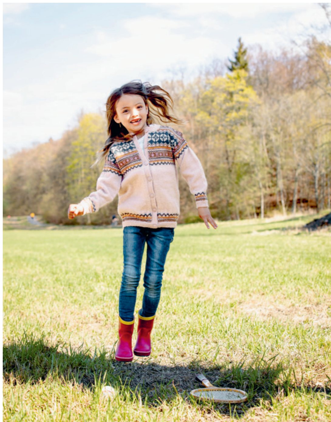
TEMA 56 | MINI ALPAKKA | \times 3 | \frac{\lambda\lambda\lambda}{27|10} | ... GRANÄSEN 14 | | | | 2-12 ÅR