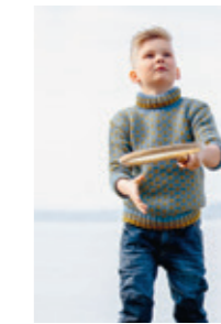
VESLEKNUT Design 5