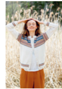
GRANÅSEN Design 7