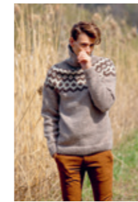
4240S Design 2