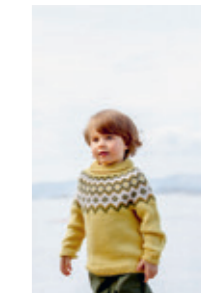
4240S Design 6