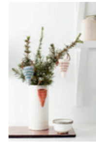
KREMMERHUS Design 2