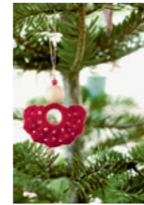
ENGEL Design 1