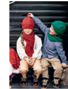
ALPELUE/SKJERF Design 5, 6