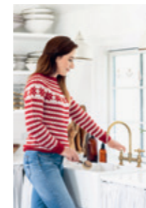
FANAGENSER Design 9