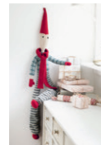
NISSE Design 22