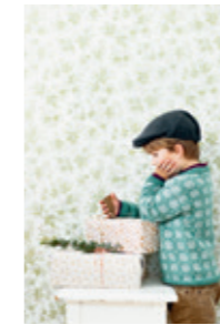
KRYSTALLGENSER Design 3