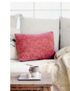
STRIPEPUTE Design 14