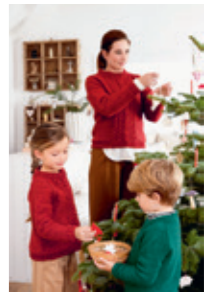
FLETTEGENSER Design 7,8