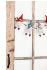
LITEN NISSE Design 19