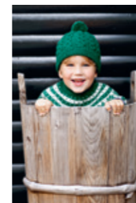
FLETTELUE Design 23