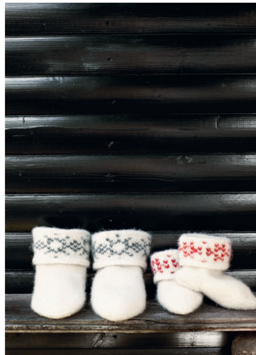
T 57 | FRITIDSGARN | X 6 | 14 110 | • TOVA SNÖKRYSTALL SOKKER 21 | 2-12 ÅR, DAME