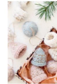
JULEKLOKKER Design 4