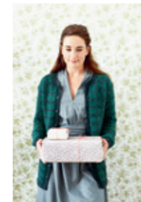
KRYSTALLKOFTE Design 16