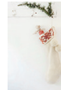
SNØKRYSTALL JULESOKK Design 18