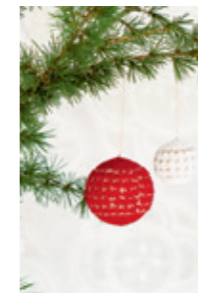
STOR, LITEN JULEKULE Design 11,12