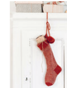
STRIPEJULESOKK Design 20