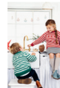
FANAGENSER Design 13