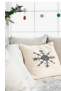
SNØKRYSTALL PUTE Design 17