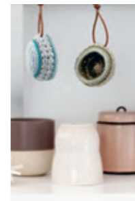
JULEHALVKULER Design 10