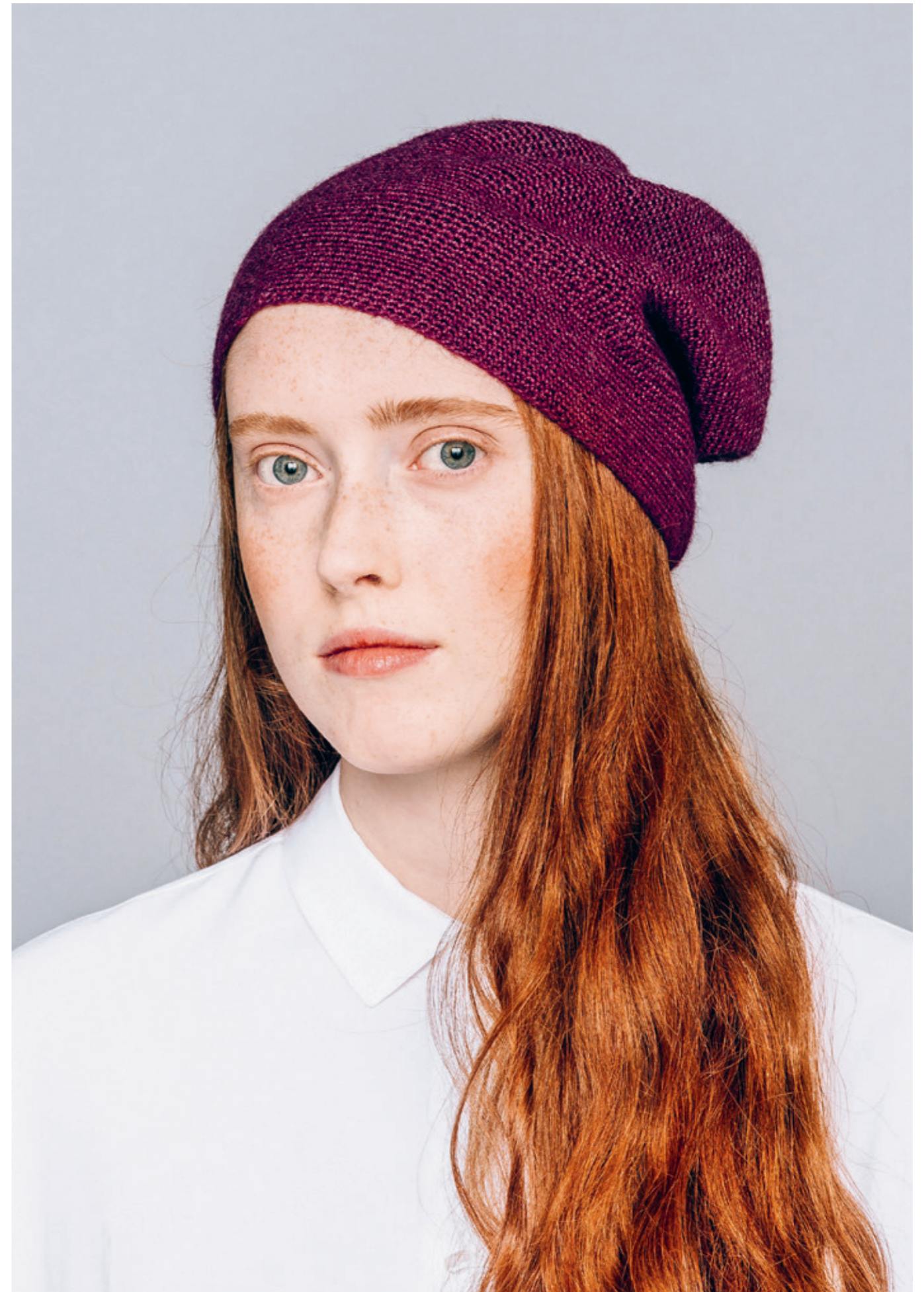
INFO 8• Heklet lue. Garn: ALPAKKA SILKE