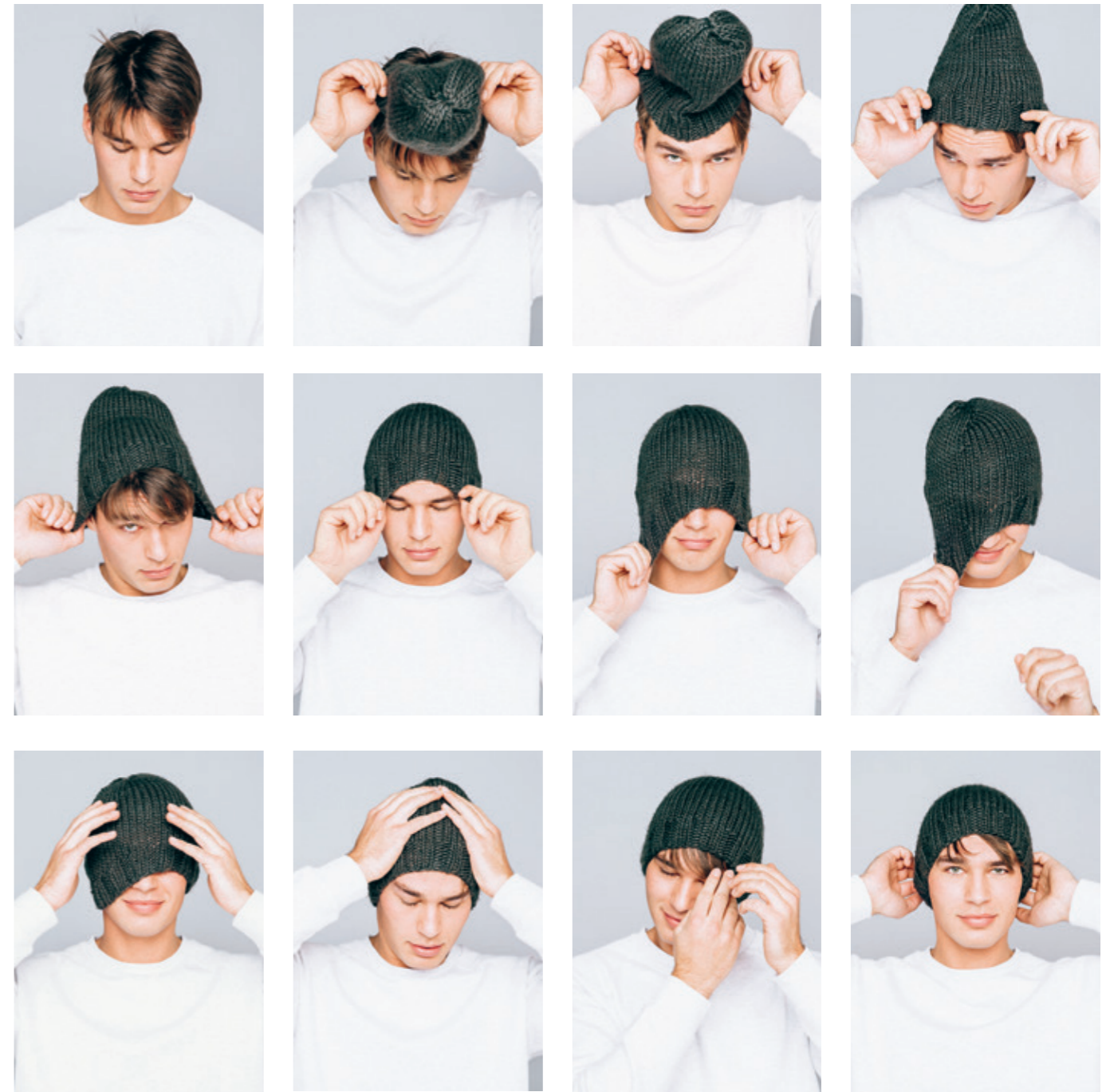
INFO 10• Glattstrikket lue. Garn: EASY