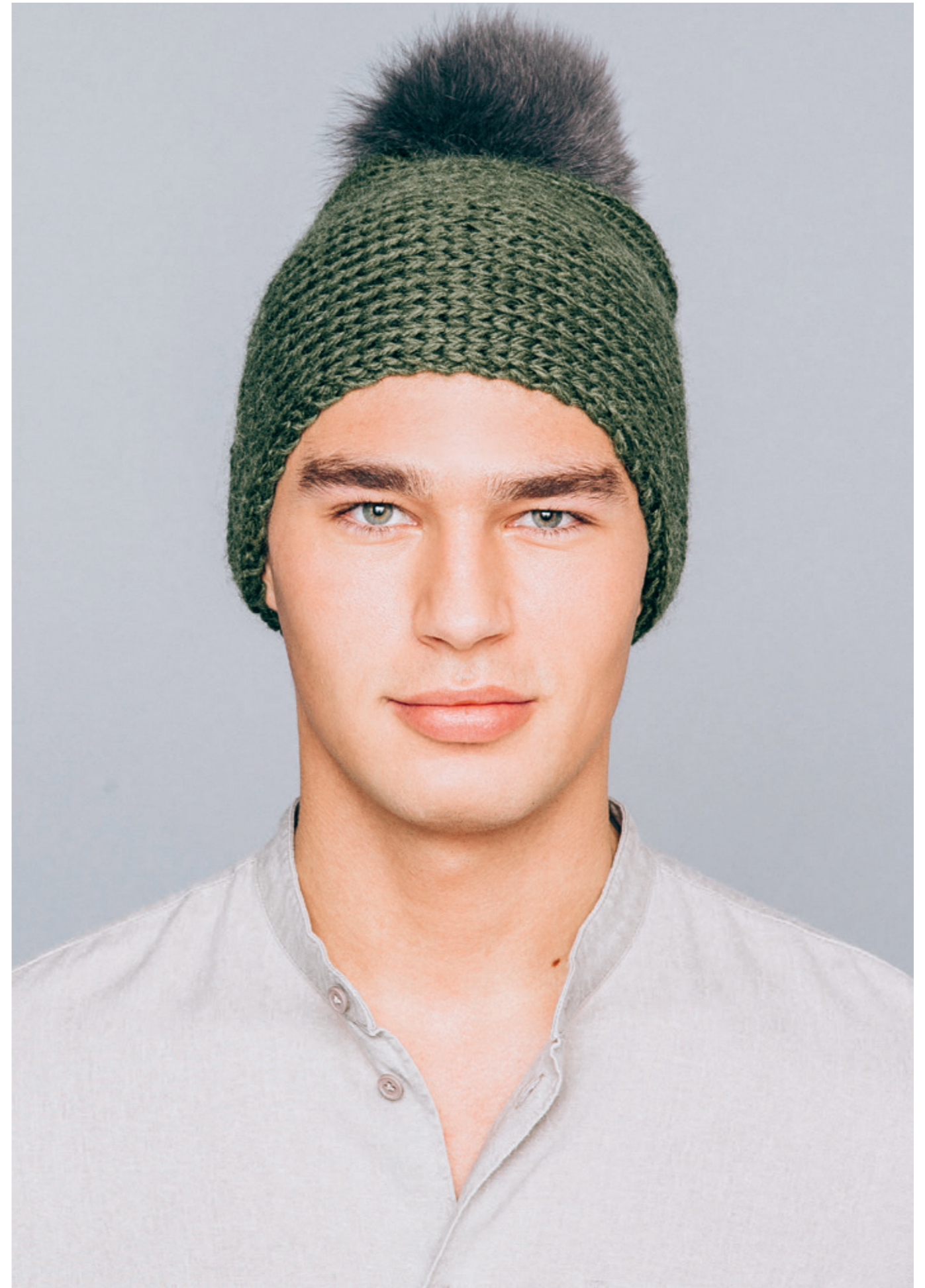
INFO 3• Glatstrikket lue. Garn: EASY / 4• Lue i vrangbord på tvers. Garn: ALFA