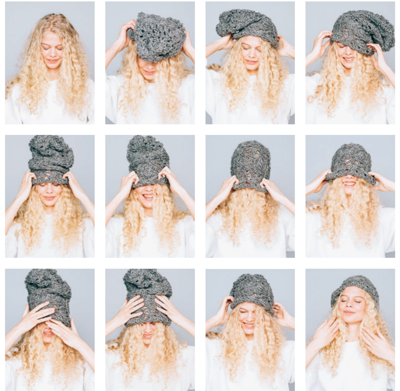
INFO 14•• Baggy lue med mønster. Garn: ALFA, TWEED