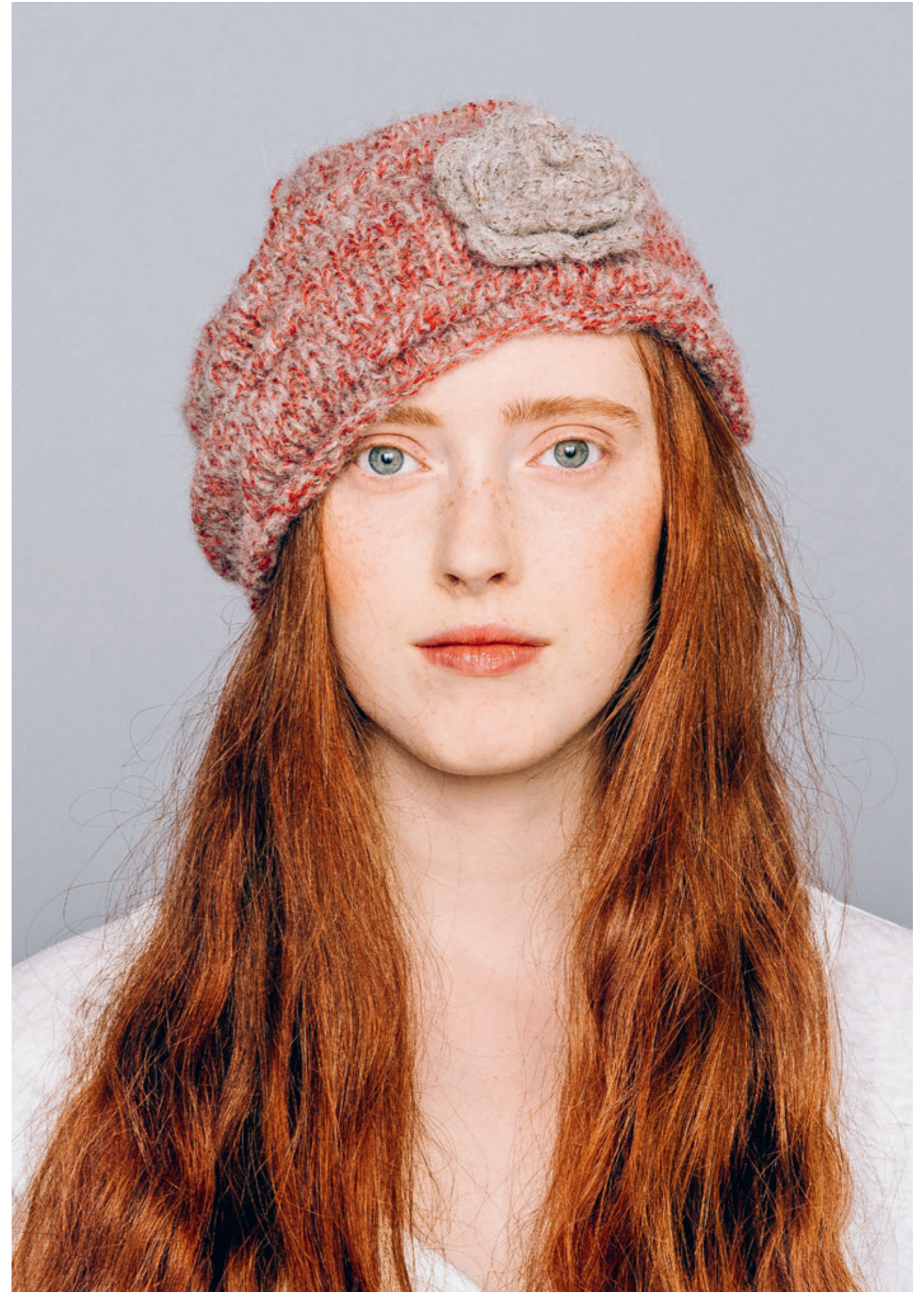
INFO 12• Baggy lue. Garn: ALFA, TWEED / 13•• Lue med biser. Garn: TWEED, ALPAKKA SILKE