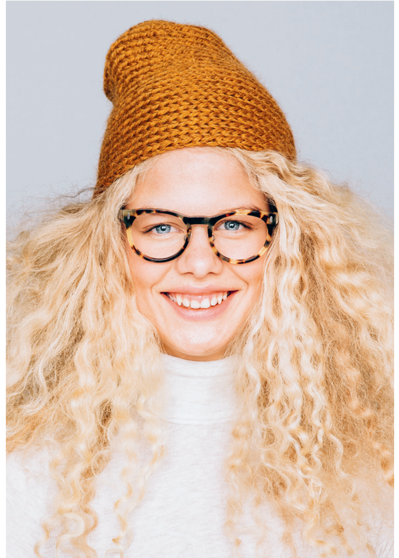
INFO 9• Feierlue. Garn: ALPAKKA ULL / 4• Lue i vrangbord på tvers. Garn: ALFA