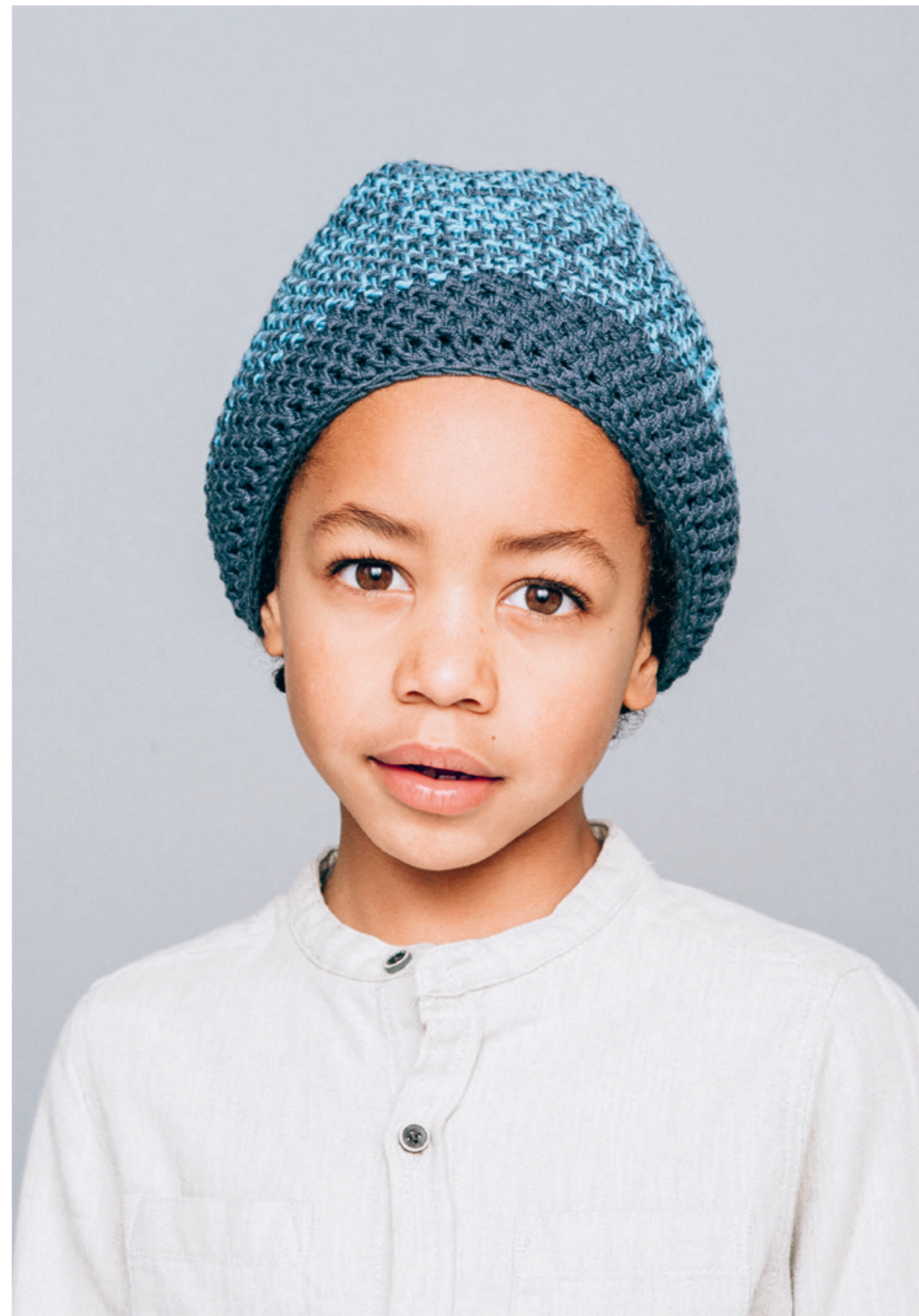
INFO 7• Lue med mønster: Garn: ALFA / 11• Heklet lue i dobbelt garn. Garn: TYNN MERINOULL